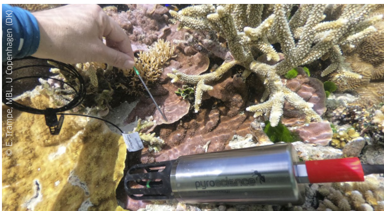
Mesures sur la Grande Barrière de Corail